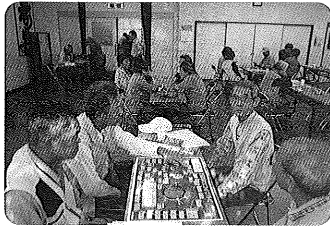
楽しんだ、エコすごろくゲーム

高齢者学級講座 いきいきはつらつセミナー 昨年は、高齢者の交通事故多発の為、事故防止講座を特別に増やして生涯学習の推進と交通安全の推進の二本柱で開催しました。 第一回は八月三十日「高齢者交通事故防止」、第二回は九月九日「景観たんけん隊」、第三回は十月十四日「エコすごろくゲーム」、第四回は十一月十一日「歴史の街萩の散策と徳佐のリンゴ狩り」の研修に出掛けリンゴ園でのみなさんの笑顔が印象的でした。来年もいきいきはつらつセミナーを通じて生涯学習推進のお手伝いが出来れば幸いです。