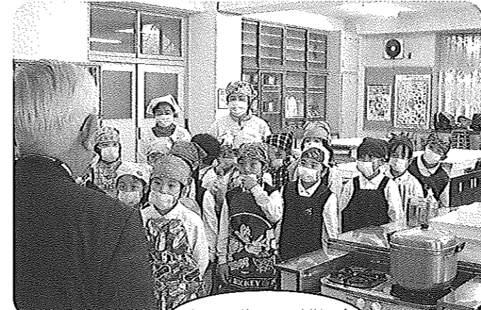
インフルエンザにも負けない徳小1年生

イは、全市を代表する覚悟でより一層の環境の整備・安全パトロール・青少年の健全育成・住民の交流活動、又伝統文化の継承や祭りなど地域の特色を生かした活動を積極的に行って参りたく、皆様のご理解とご協力をお願い申し上げます。終わりに皆様のご健康とご多幸を祈念いたしまして新年のごあいさついたします。