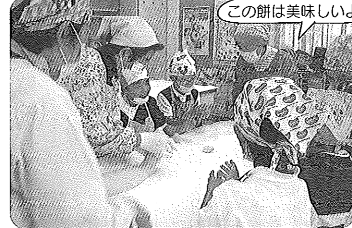
この餅は美味しいよ