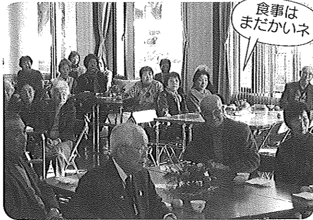
食事はまだかいネ