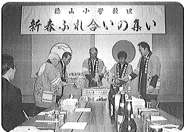
徳山小学校区 新春ふれあいの集い

一月八日(金)に「新春ふれあいの集い」が保健センターで開催されました。市内の各種ボランティア、約十五団体の代表と各地区自治会の有志を含み総勢約百五十名が集まりました。来賓の挨拶の後食事をしながら、昨年の反省と今年の活動方針について語り合いました。進行係の中央地区体育振興会の皆さんの尽力もあって約二時間、楽しく有意義な時間を過ごしました。日頃あまり顔を合わせることが少ない人達とのふれあいは今後のボランティア活動に少なからず、役立つものと思います。