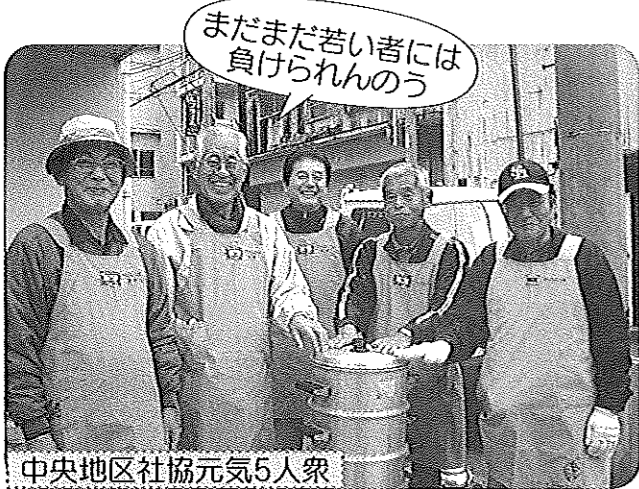
まだまだ若い者には負けられんわ