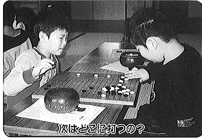
次はどこに打つの?