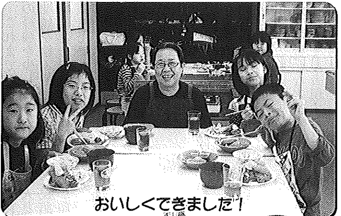
おいしくできました!

今年、毎月第二土曜日の子ども料理の申込み者は、3年生から5年生までで13名(2名は男子)でした。四月の第二土曜日からスタートしました。「おはようございます」の声かけから手洗、調理器具のある場所、使い方を説明するがチンプンカンプンの顔をして聞いています。やはり、その時にならないとわからないんですね。左手に手の何倍もある大根を持って皮をむこうとして、「どうしたらいいのかなあ?」という表情で私達の顔を見つめています。すかさず行って「半分は切って、この皮むき器を使うと便利で手を切らないでいいよ」と実演して見せます。今は魚も三枚におろせるようになりました。