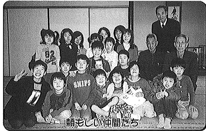
頼もしい仲間たち

子ども囲碁将棋教室は発足以来六年目を迎えました。本年度は男女十六名(男子十四名、女子二名)の子どもが対局を楽しんでいます。指導者を含め相手を替わりながらの対局で子どもたちも新鮮な気持ちで取り組んでいます。今年度は低学年が多いので、基本に重点をおいて楽しい中にも節度のある行動ができることを目標の一つに掲げています。対局中の子どもの表情は写真を見ても分かるように真剣で集中した時の姿は頼もしくも見えます。囲碁将棋を通じて勝負だけにこだわるのではなくルールを守り相手を思いやる心を育てるなど人として大切なことも身につけてくれることを願っています。