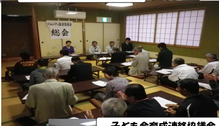
コミュニティ推進協議会