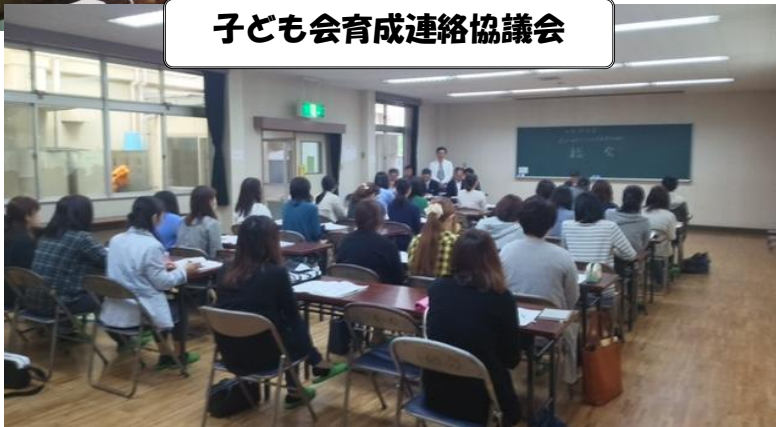
子ども会育成連絡協議会