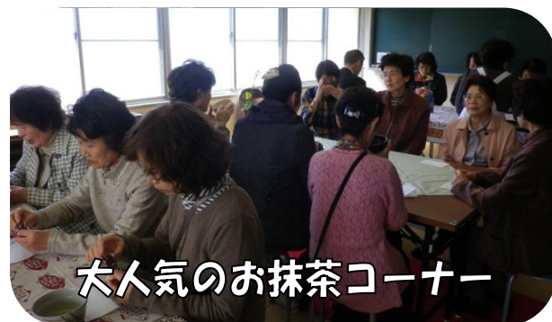
大人気のお抹茶コーナー