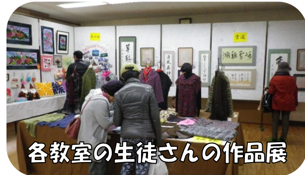
各教室の生徒さんの作品展