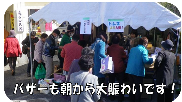
バザーも朝から大賑わいです！