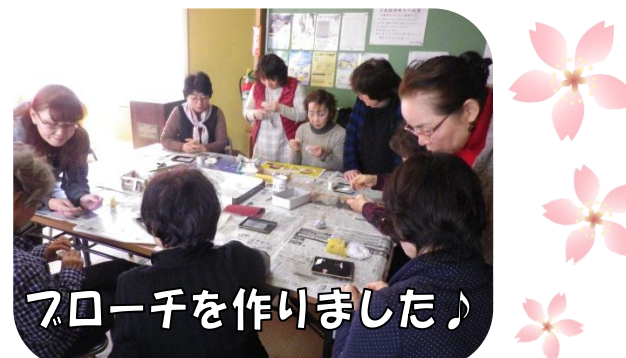
フローキを作りました♪