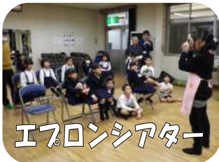
エフロンシアター