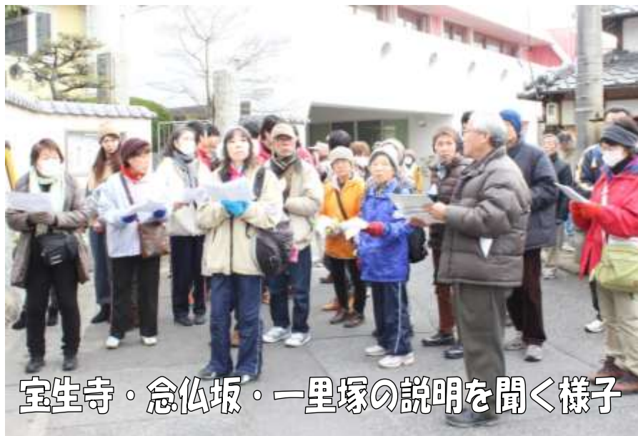
宝生寺・念仏坂・一里塚の説明を聞く様子