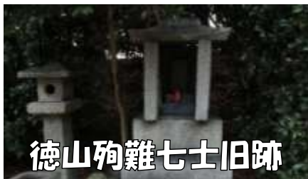
徳山殉難七士旧跡