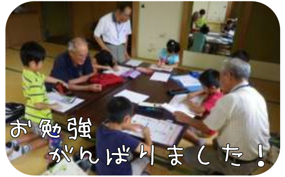
お勉強 がんばりました!