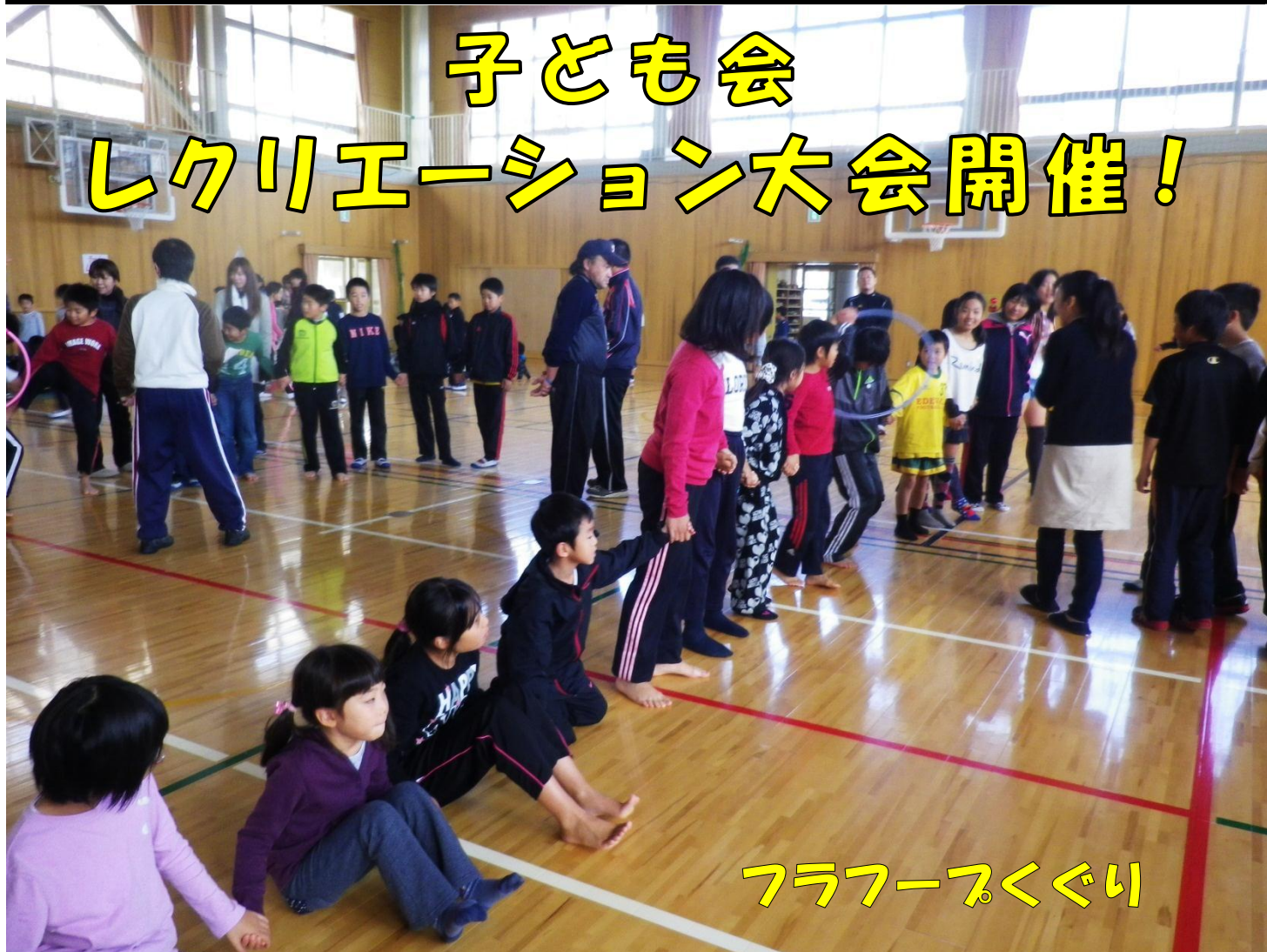
フラフープくぐり