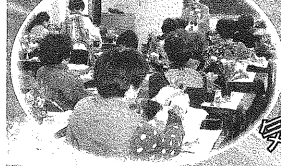
花の寄せ植え講習会