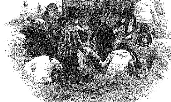
わいわいクラブ 芋ほり