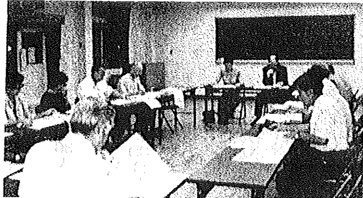
生涯学習推進協議会 公民館運営協議会・合同会議