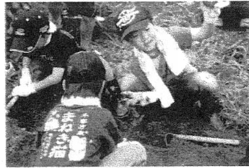
↑ 6/27 わいわいクラブ「どろんこ畑の冒険」 じゃがいも堀り・さつま芋の苗植え

7月3日、趣味文化クラブの総会が開かれ、平成20年度事業報告/決算/監査報告のあと 21年度事業計画/予算など審議され承認されました。総会終了後、「しゅうなん出前トーク」 だまされないうそー審判商法について市消費生活センター河村さんから被害にあわないための アドバイスを受けました。