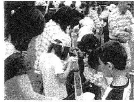
↑ 6/27 そうめん流し → 7/3 趣味文化クラブ・総会