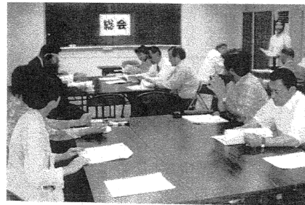
↑ 20日 社会福祉協議会・総会 20日 コミュニティ推進協議会・総会