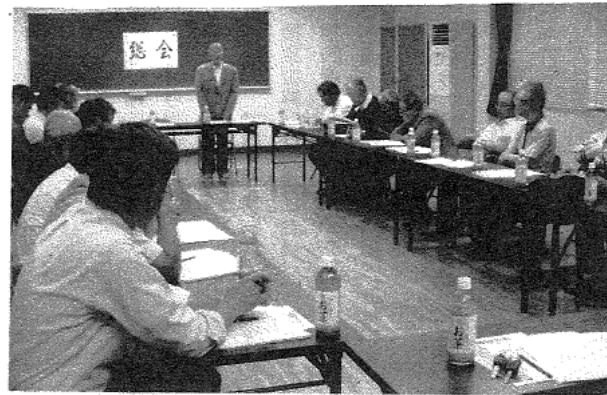
↑ 13日 自治会連合会・総会