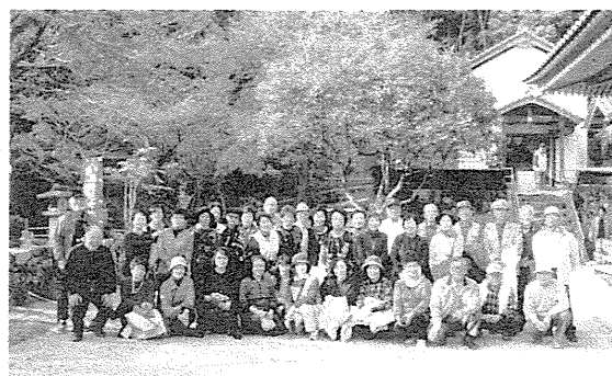
↑ 11/27 趣味クラブ研修旅行