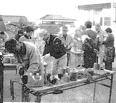
↑ 12/19 ミニ門松づくり

12月19日、今まで行っていた「しめ飾り講習会」から初めての「ミニ門松づくり」を開きました。指導者にはボランティアグループ（ゆづきの会）もあれこれ試行錯誤でしたが、何とか参加者の皆さんに満足のいくミニ門松をつくれることができました。