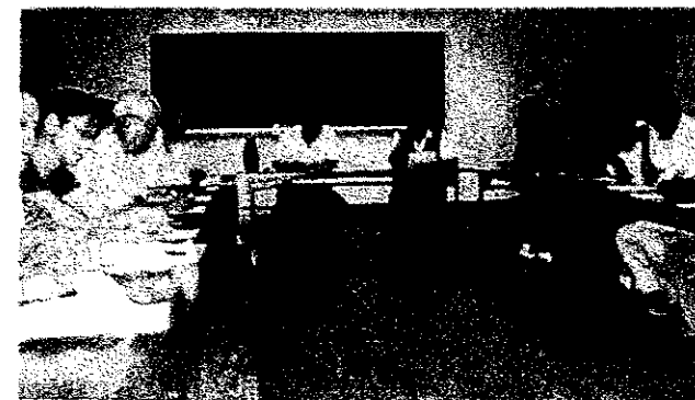
9/24 地区秋まつり出店者会議