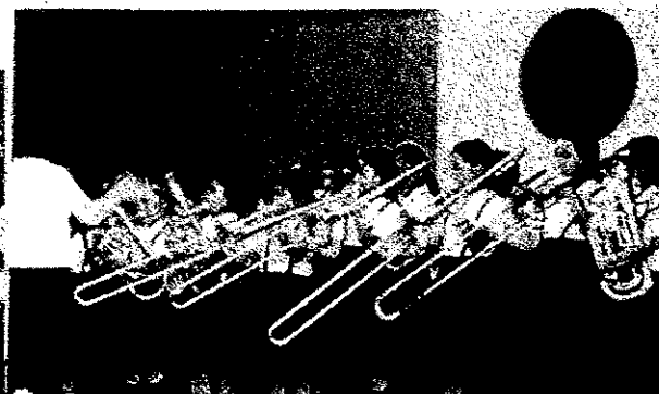
9/13 敬老会 (遠石小学校・講堂)