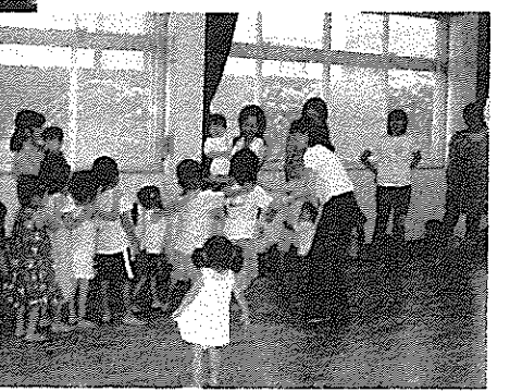
← 8/19 子育ていきいきサロン

「県道/市道」の歩道周辺の清掃をしました 7月27日猛暑の中「県道(新南陽/下松線)」「市道(遠石/一の井手線)」「市道(遠石/江口線)」を自治会・コミュニティ・交通安全協会遠石支部の呼びかけで歩道周辺の清掃活動が行われ100名を超える皆さんが早朝からたばこの吸殻や空き缶、植え込みの見えにくいところを拾ってくれたのにも驚きました。ご協力ありがとうございました。