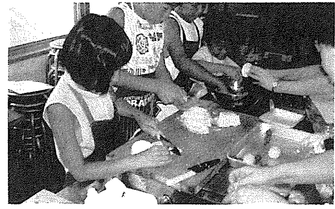
↑ 7/25 夏休み子ども料理教室