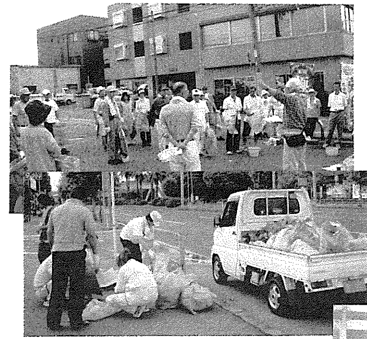
↓ 7/27 県道・市道の清掃活動