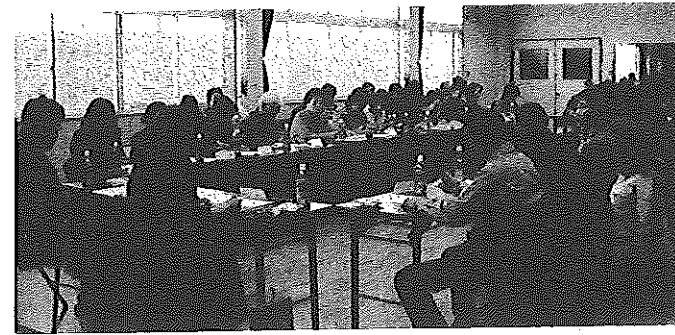
↑ 2/5 公民館趣味文化クラブ《文化祭実行委員会》 ↓ 2/8 老人クラブ女性部《折り紙教室》

各地区担当の民生委員さんか、福祉員さんが対象となる方に別紙チラシを配布します。詳細についてはお聞きください。