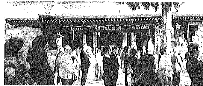
↑ 2/11 スタンプリリーともちつき ↑ 建国記念の日奉祝行事