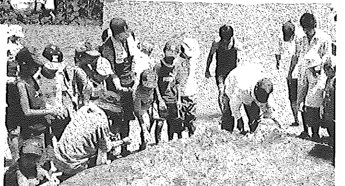
↑ 8/18 親子ふれあい地びき網体験 (大津島・刈尾)