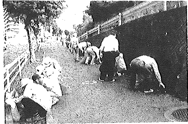
↑ 8/5 県道(新南陽~下松線)清掃活動

8月5日、自治会・コミュニティ・交通安全遠石支部の呼びかけで「遠石3丁目交差点から周防食糧前交差点」まで、歩道周辺の清掃活動が行われ、80名を超える皆さんが酷暑の中、早朝から空をよぎる汗を流しながら、清掃活動を行いました。ご協力ありがとうございました。