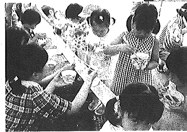
← 8/21 遠石子育ていきいきサロン (ソーメン流し)