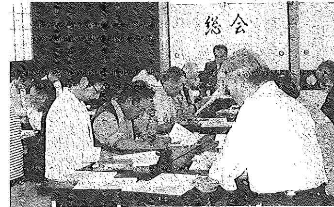
↑ 5/23 社会福祉協議会・総会 5/23 コミュニティ推進協議会・総会