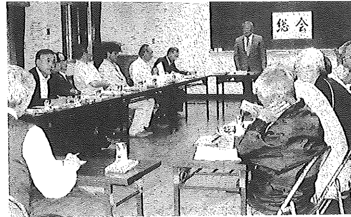
↑ 5/16 自治会連合会・総会

☆地域ふれあい活動の充実《秋まつり・どんと焼きなど》 ☆子どもサポート事業の充実《自然体験・わいわいクラブほか》