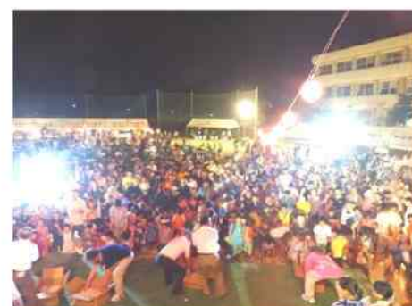
餅まきで閉会しました。

5月から、盆踊り&花火大会実行委員会を立ち上げ、話し合いを繰り返し、段取りや関係機関への届出等を行い、前日及び当日準備、翌日及び翌々日の片づけ、会場清掃に至るまで、大変お疲れ様でした。みなさまの夏の思い出となりましたでしょうか？