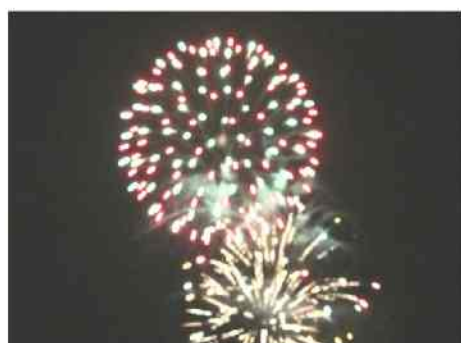
花火を打ち上げました。