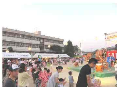
須々万保育園、須々万幼稚園の園児と保護者で、盆踊りを踊りました。