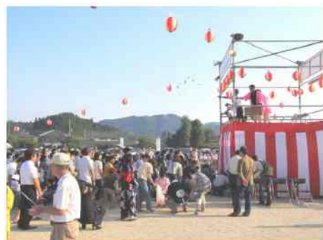
信号弾の合図とともに、菓子まきを行いました。

酷暑の中、皆様から多大なるご支援をいただき、誠にありがとうございました。お陰をもちまして、大会を盛会裏に終えることができましたことに、心より厚く御礼申し上げます。