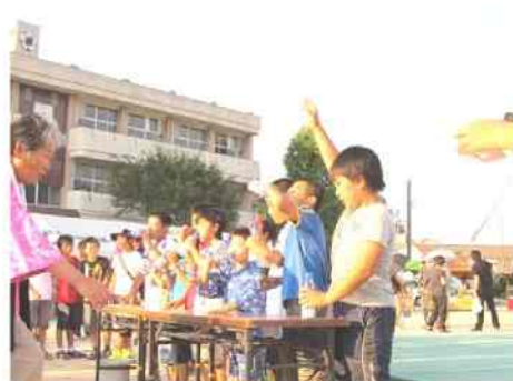
すすまっこ ラムネ早飲み大会 「はい、飲みました。」