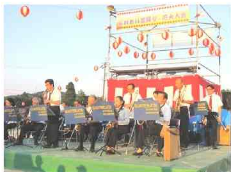
カルチュラタンエクスプレス オーケストラによる演奏