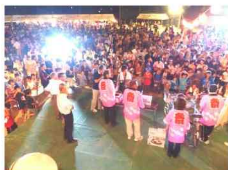
福引大抽選会 特賞は旅行券と自動掃除ロボでした。