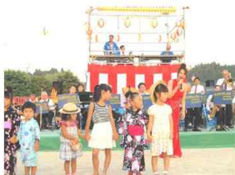
となりのトトロなどを一緒に歌いました。