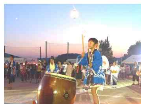
続いて、地区の方々による盆踊りを行いました。