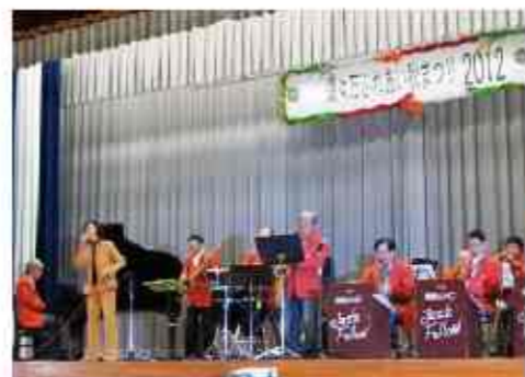
ジャズフェローオーケストラ