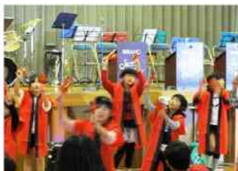
沼城小学校3、4年生 よさこい

雨が降り、沼城小学校体育館及びその周辺での実施となりました。 ご協力いただきました皆様、大変ありがとうございました。