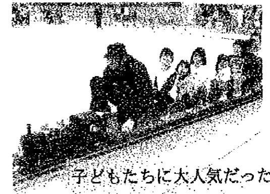
子どもたちに大人気だったミニSL