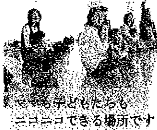
ママも子どもたちもニコニコできる場所です

ひりりクラブ「親子遊びの広場」2006年の活動は 2006年1月16日(月)からです。