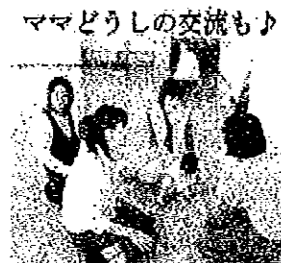
ママどうしの交流も♪

各地区や団体のお知らせなど、地区だより「すすま」への情報は、お気軽に公民館までお願いします すすま公民館88-0001 中村まで。