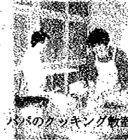
パスタのクッキング教室