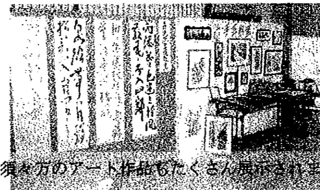
須々万のアート作品もたくさん展示されました