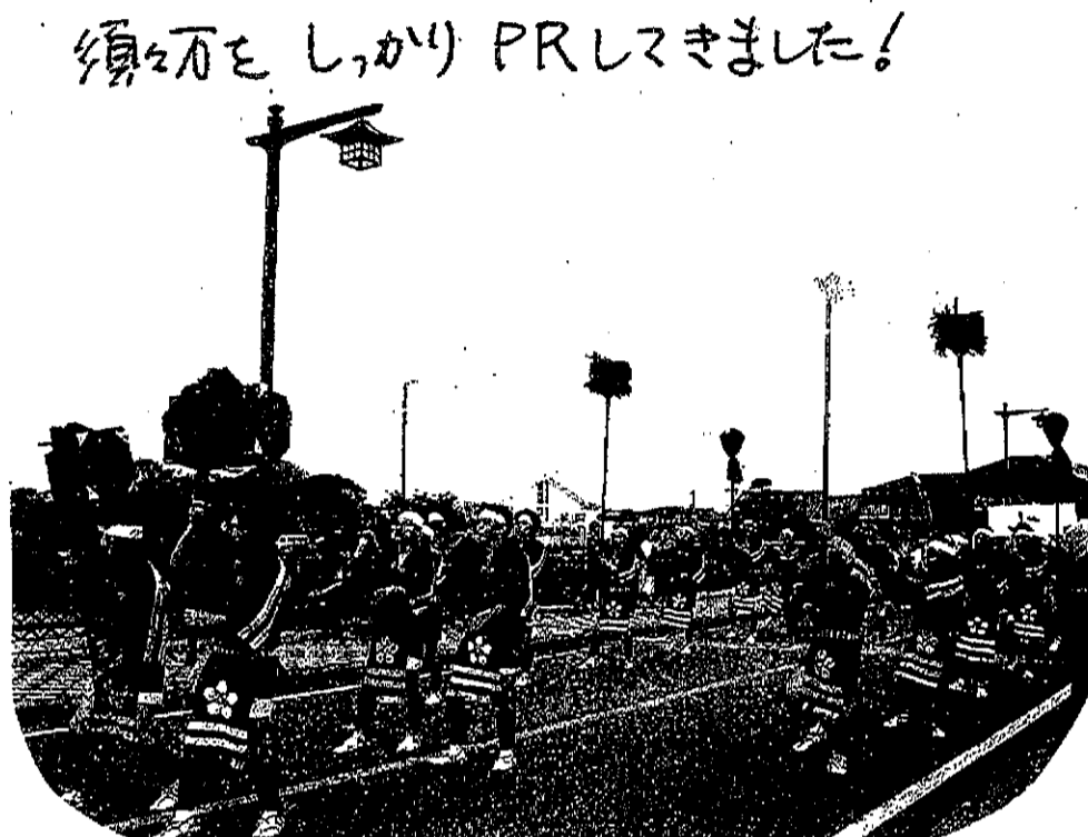
須万を、しっかりPRしてきました!