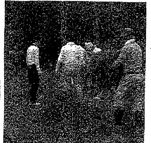
(主管) ふれあいの森ほんご工房 ほたる清流会 子ども会連合会