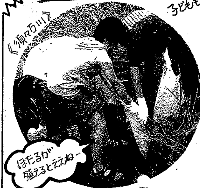
「ほたる川」 「ほたるか」 「殖えるとええね」