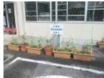
↓1月に風を飾っていただきました