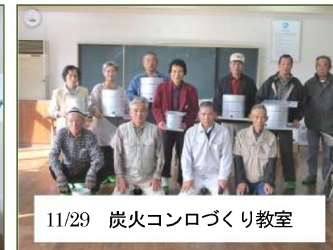
11/29 炭火コンロづくり教室