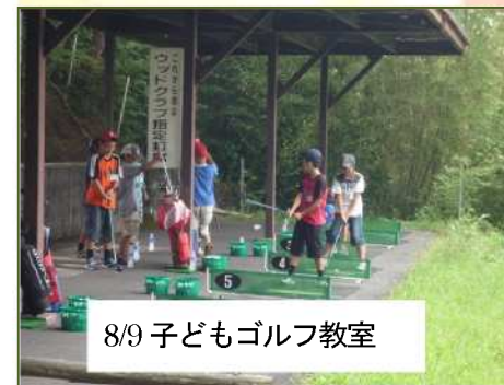
8/9 子どもゴルフ教室