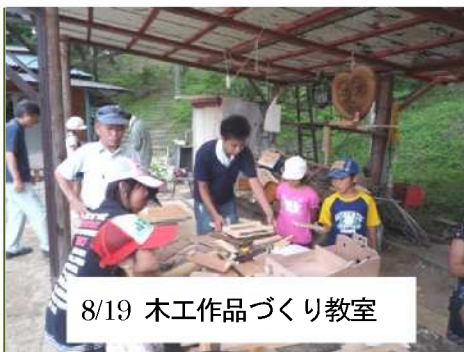
8/19 木工作品づくり教室