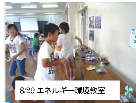
8/29 エネルギー環境教室