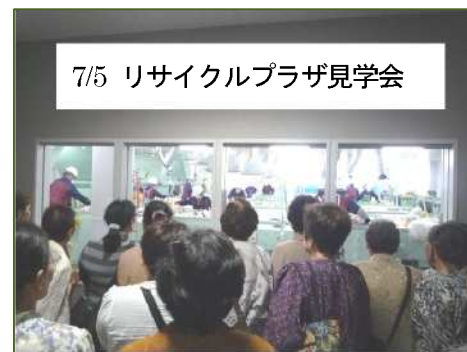
7/5 リサイクルプラザ見学会

公民館講座(7/29 子ども茶道教室など)の開催、コミュニティ活動支援(7/8 水と緑の一斉大奉仕作業、8/13 盆踊り&花火大会、10/16 須々万地区まちづくり推進協議会30周年記念行事、1/9 新年互礼会など)を行いました。平成24年度も同様の活動を予定しています。ご参加ください。