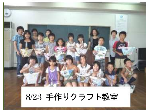
8/23 手作りクラフト教室