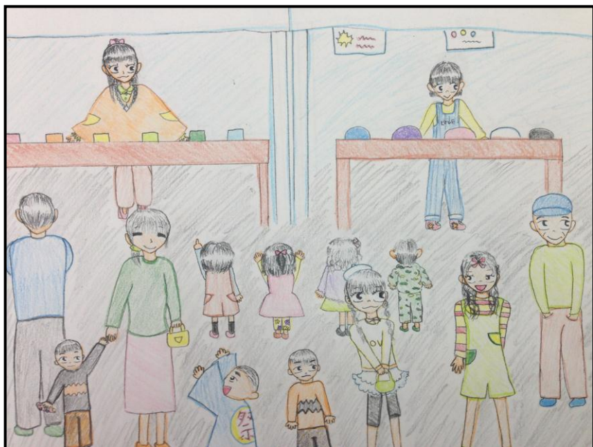
イメージ画／須磨小学校 石引未暢子

徳山藩領であった須万は、元禄三年（1690年）から年に一度、1月21日だけ市の開催を藩から許可されていました。以降、和紙の取引や宿場町として繁栄し、昭和40年頃まで市日は開催されていました。須金市日は、当時の活気を取り戻そうと、須金の食、自然、歴史などの魅力をいっぱい詰めて、地元住民が3年前から復活させました。時空を超えて、賑わいあふれる山代街道へ、ぜひお越しください！