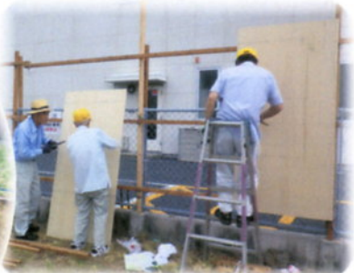
ご芳名看板も今年は新しいものにしました