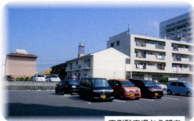
東側駐車場から望む

そしてこの七月に徳中社宅隣の西京銀行の独身寮、社宅の方たちが引っ越しされて、今に至ります。