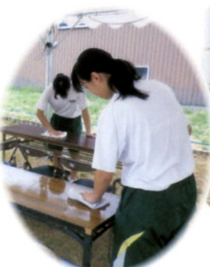
中学生も準備に汗を流してくれました