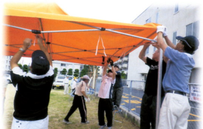
準備には各自治会からも多数の方に協力いただきました