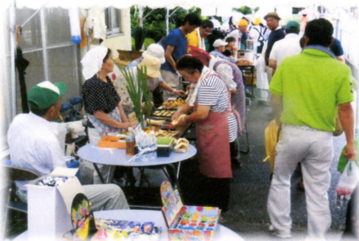
公民館の外ではテントの中でバザーも賑わって・・・