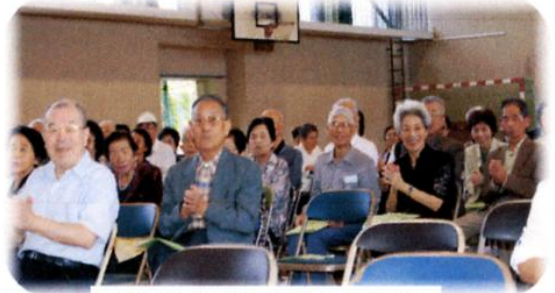
皆さんで楽しいひとときを

10/24 交通安全 きらきら体操 周南警察署員の方が公民館において「周陽同好会」のメンバーに「交通安全きらきら体操」を指導されました。 交通安全に関する言葉が随所に入っていて、覚えやすく気をつけようという気持ち自然湧いてくるようです。