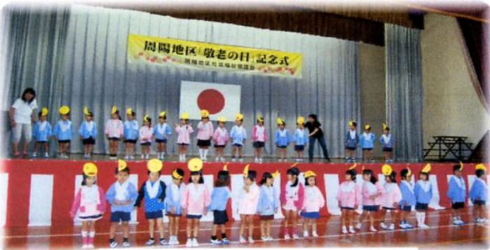
元気いっぱい周栄幼稚園園児のおどり

去る九月二十八日(土) 周陽地区「敬老の日記念行事」が、今年も周陽中学校の体育館を会場として行われました。準備、後片付けを中学校の生徒も一緒に手伝ってくれました。おかげで様子が今までと異なる会場作りもスムーズに進めることが出来、大変助かりました。 今年の対象者数は七百四十八名で、内、百七十六名の参加をいただきました。