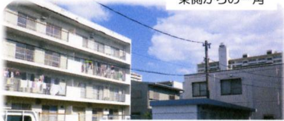
西側から自治会の一角を望む

配布されるようになり、ゴミ箱も設置され、今まで路上でカラスに手を焼いておりました事も遠い昔の事となりました。 今では近所とも仲良く、公民館の皆様をはじめ、多くの方々と一緒に日々を過ごしております。小規模の自治会ですが、よろしく願い申し上げます。