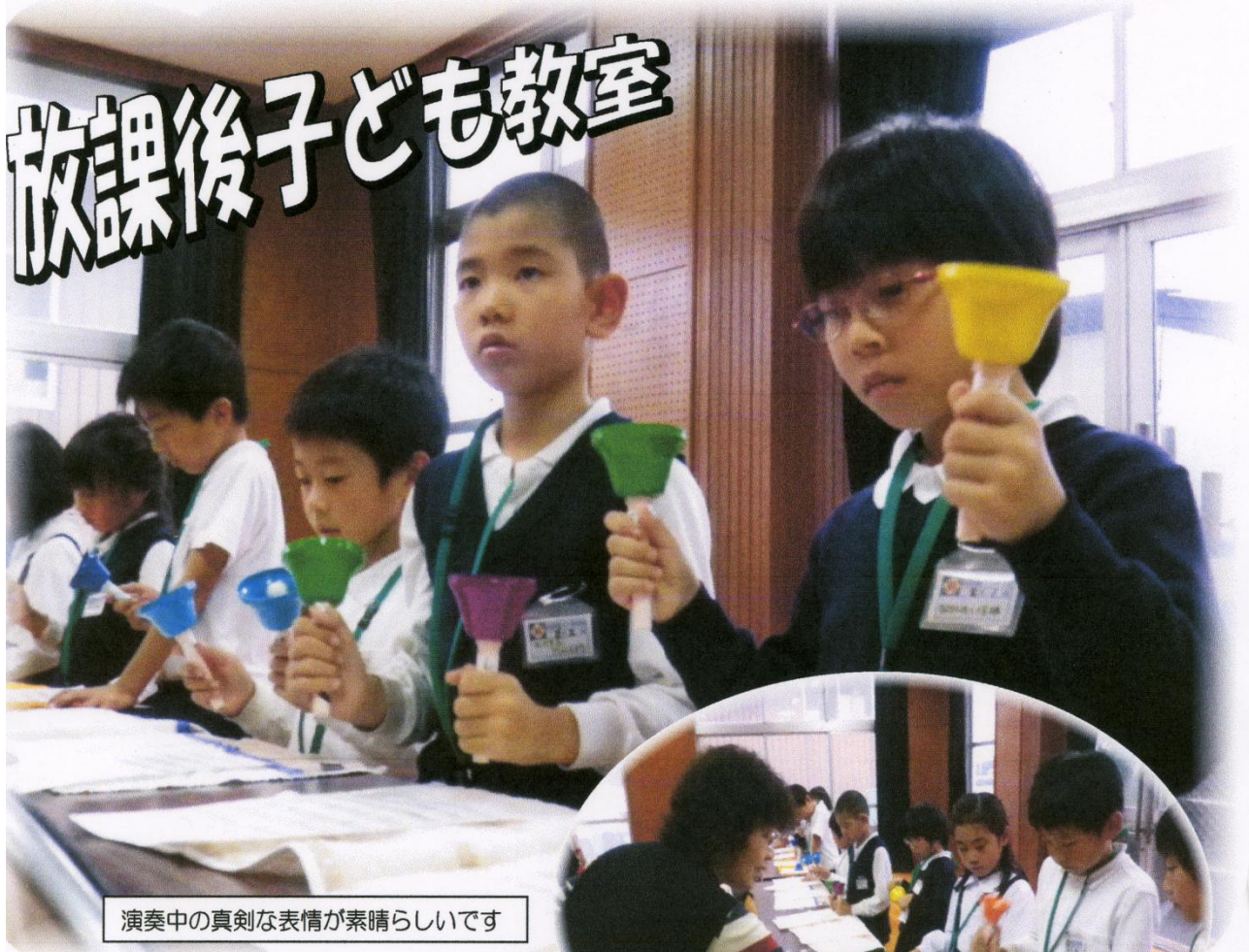
演奏中の真剣な表情が素晴らしいです