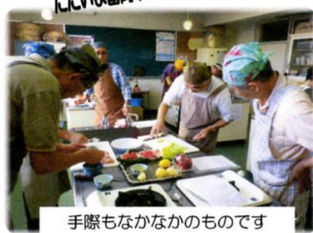
手際もなかなかのものです

月一回の教室ですが、皆さん随分楽しみに参加されています。基礎からしっかり学ばれていますよ。家庭に帰られての復習は？とそこが気になるところです・・・。