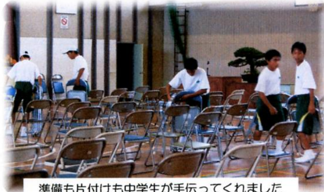
準備も片付けも中学生が手伝ってくれました