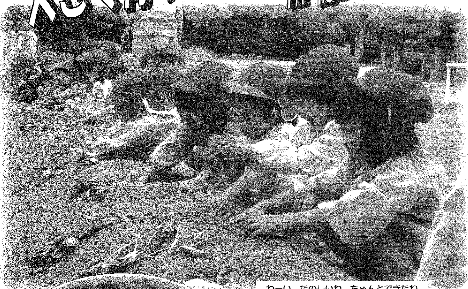
わーい、たのしいね ちゃんとできたね