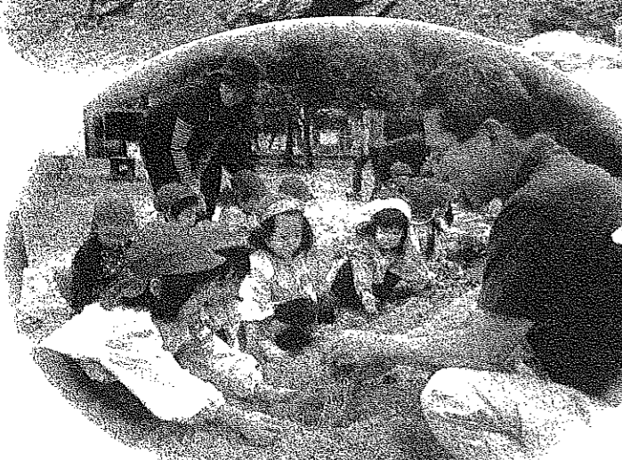
植え方を教わって頑張りました