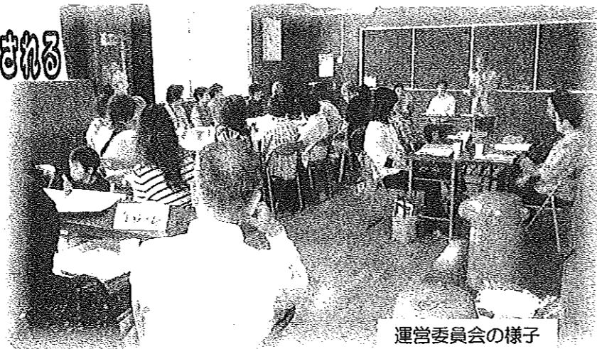
運営委員会の様子

学習機会を上手に活かし充実した生活を送る皆さんに乾杯! ただし、ルールは守ってくださいね。