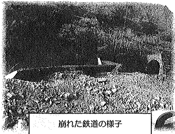
崩れた鉄道の様子

現地の方を通じて、「生きる」と言う言葉を強く感じました。家族や多くの友人・知人が一瞬のうちに亡くなる。この現実を受止めながら、それでも、みんな前をむいて進んでいました。自分たちの方が苦しいはずなのに、ボランティアの私たちに、たくさんの暖かい言葉をかけてくれました。『ありがとう』この言葉は人と人とを繋ぐ魔法の言葉だと思えます。今回、災害ボランティアに参加して、どんな状況でも諦めてはいけないことを強く教えられました。