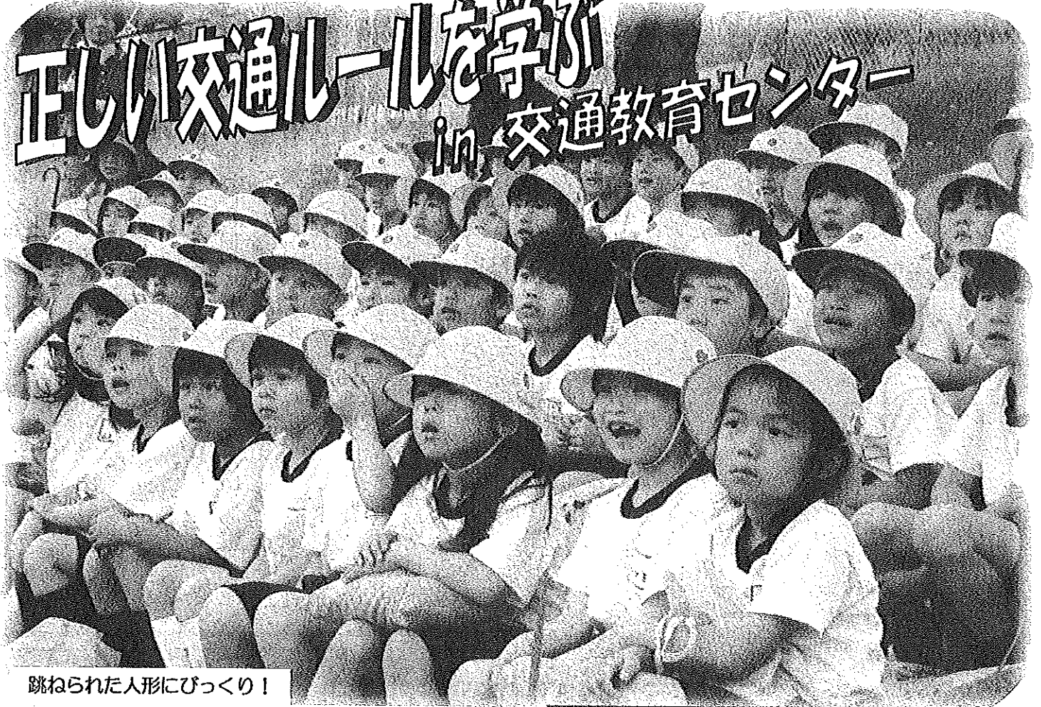
跳ねられた人形にびっくり！