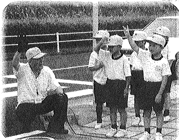
サイン！右よし！左よし！信号よし！確認して、さあ渡ろう