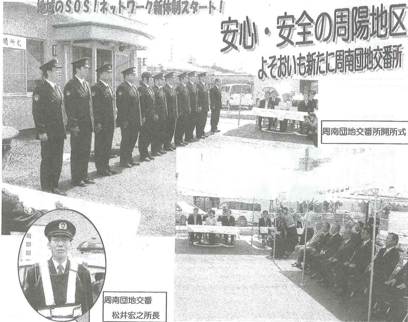
周南団地交番所開所式