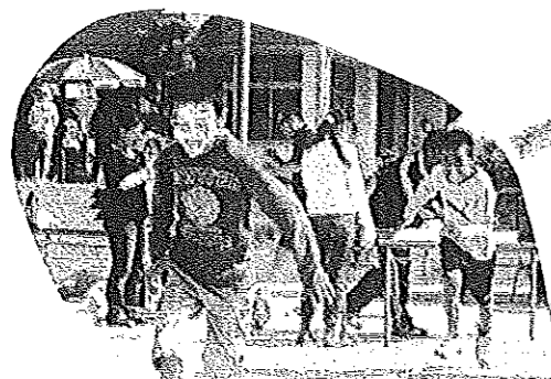
あめくい競争 あれ〜？歌舞伎役者に大変身？

さわやかな好天にも恵まれ、地域の老若男女が競技に、観戦に、おしゃべりにと、大いに楽しんでいました。みなさんのいい顔‘ワンショット’ご覧下さい！