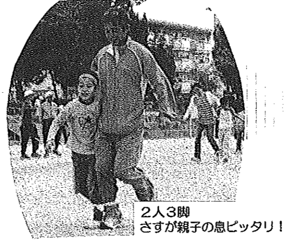
2人3脚 さすが親子の息ピッタリ！