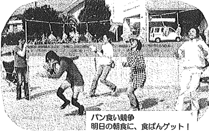
パン食い競争 明日の朝食に、食べんゲット！