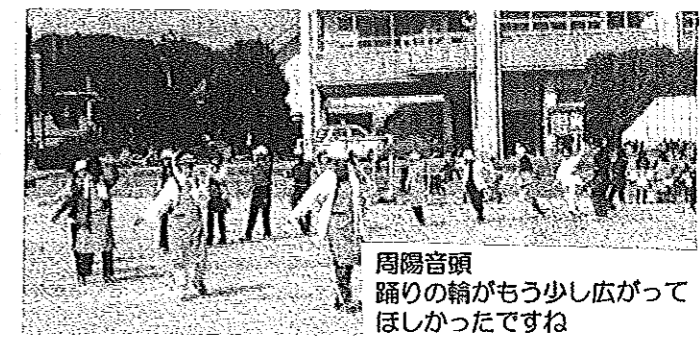
周陽音頭 踊りの輪がもう少し広がってほしかったですね