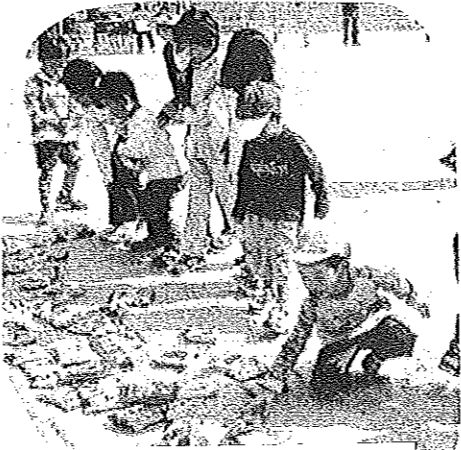
幼児の宝探し どれにしようかな〜？