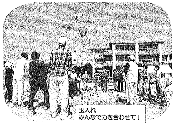
玉入れ みんなで力を合わせて！