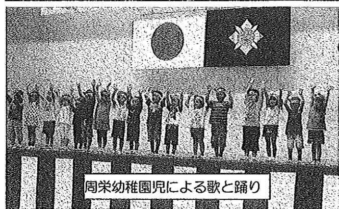
周栄幼稚園児による歌と踊り

『カルテラタン・エクスプレスオーケストラ』の演奏 途中演奏にあわせて美声が〜♪〜♪ 会場の中にマイクを持っている方を発見