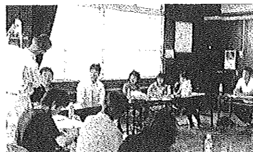
周陽地区生涯学習推進協議会

両会とも、地域の活性化や、『住みよいまちづくり』につながるような案が多方面から協議され意義深い会となりました。