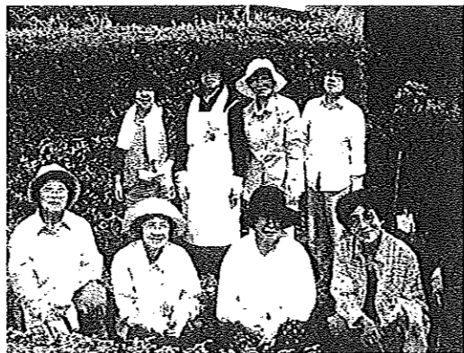
当日作業された皆さん

夏に向けて、地域が「サルビアの赤い花」と「マリーゴールドの黄色い花」でいっぱいになるといいですね。