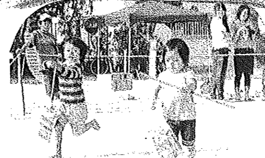
上手にあやつろう 「だからものがあつたよ〜」