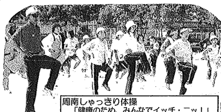
周南しゃっきり体操 「健康のため、みんなでイッチ・ニッ!」