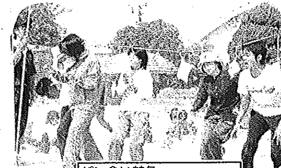
パン食い競争 「大きな口をあけて、パクッ」