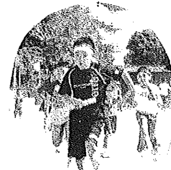
対抗年代別混合リレー 「ほくにまかせて!」