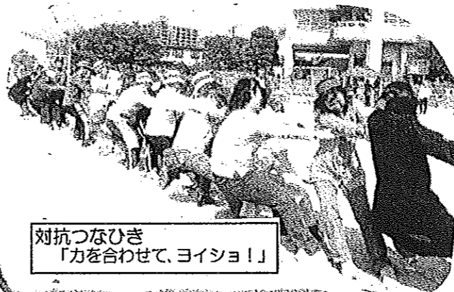
対抗つなひき 「力を合わせて、ヨイショ!」