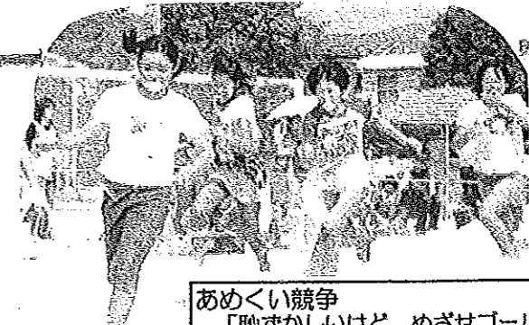
あめくい競争 「恥ずかしいけど、めざせゴール」