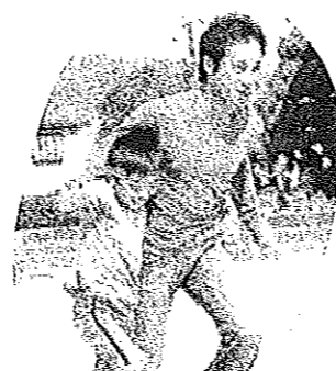
2人3脚 「お父さん待ってよ〜」