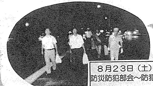
8月23日(土) 防災防犯部会~防犯パトロール~