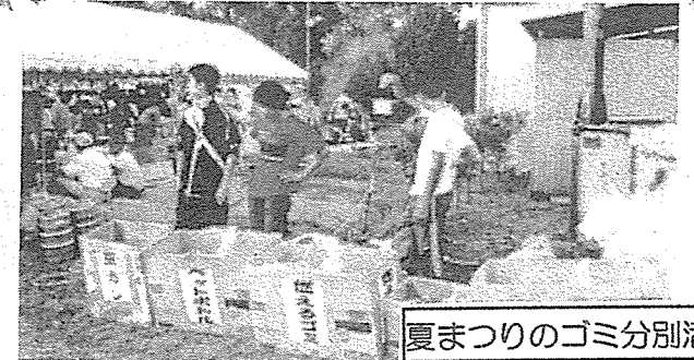
夏まつりのゴミ分別活動