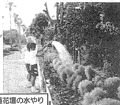
緑道花壇の水やり