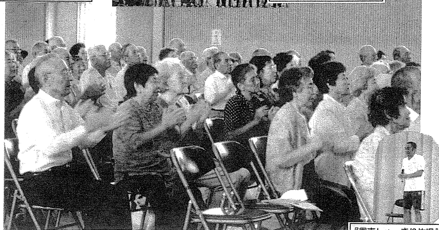
『周南しゃっきり体操』

9月13日(土)周陽小学校体育館において第8回周陽地区「敬老の日」記念行事が開催されました。周陽地区では75歳以上の対象者、623名の内162名の方々が、式典に臨まれた後、数々のアトラクションを楽しまれました。