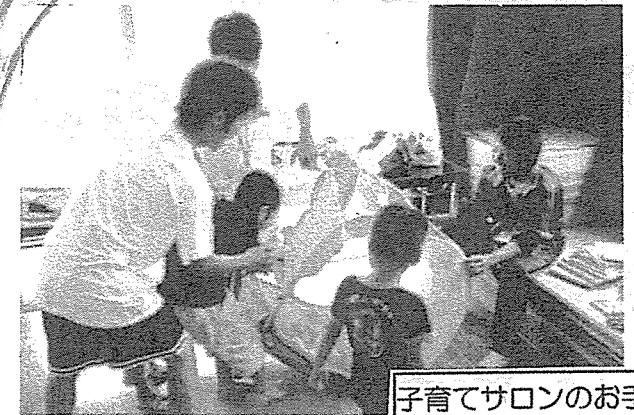
子育てサロンのお手伝い