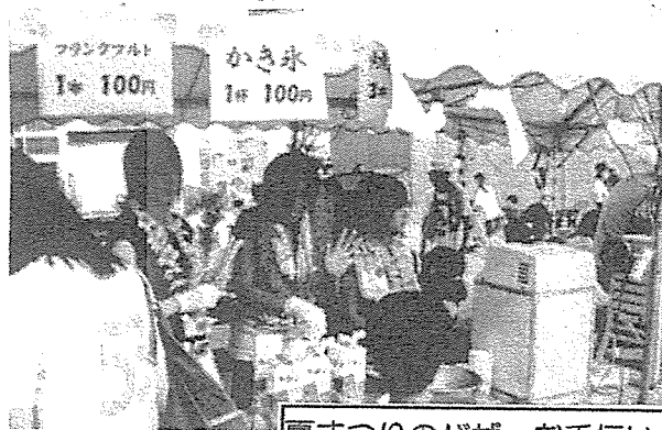
夏まつりのパザーお手伝い