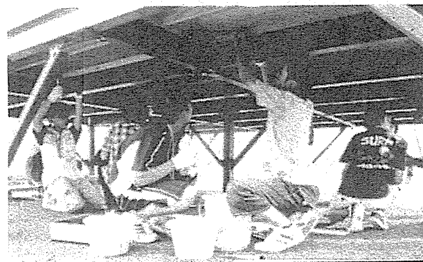
夏まつりの舞台づくり