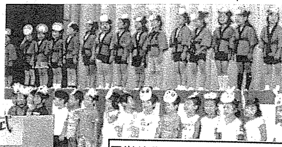
周栄幼稚園児による歌と踊り