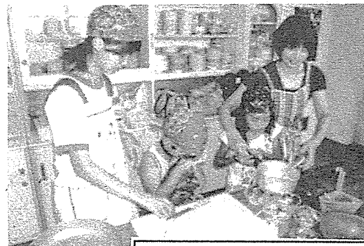
子ども料理教室のお手伝い