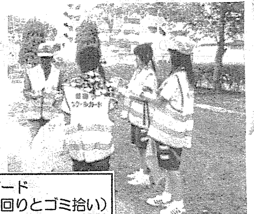
スクールガード (公園の見回りとゴミ拾い)