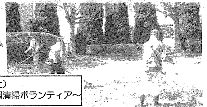
9月20日(土) 青雲会~緑道公園清掃ボランティア~