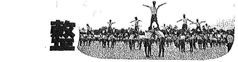
周陽小(23日)・中学校(9日)大運動会が開催されました。厳しい残暑の中、子供たちの歓声が響きわたりました。