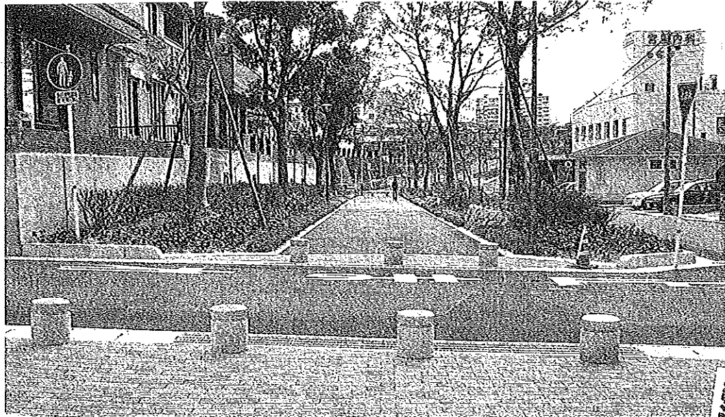
大内町(西緑地公園側より撮影)