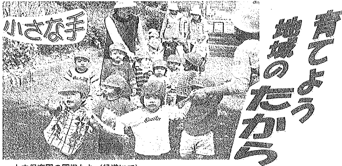
大内保育園の園児たち（緑道にて）