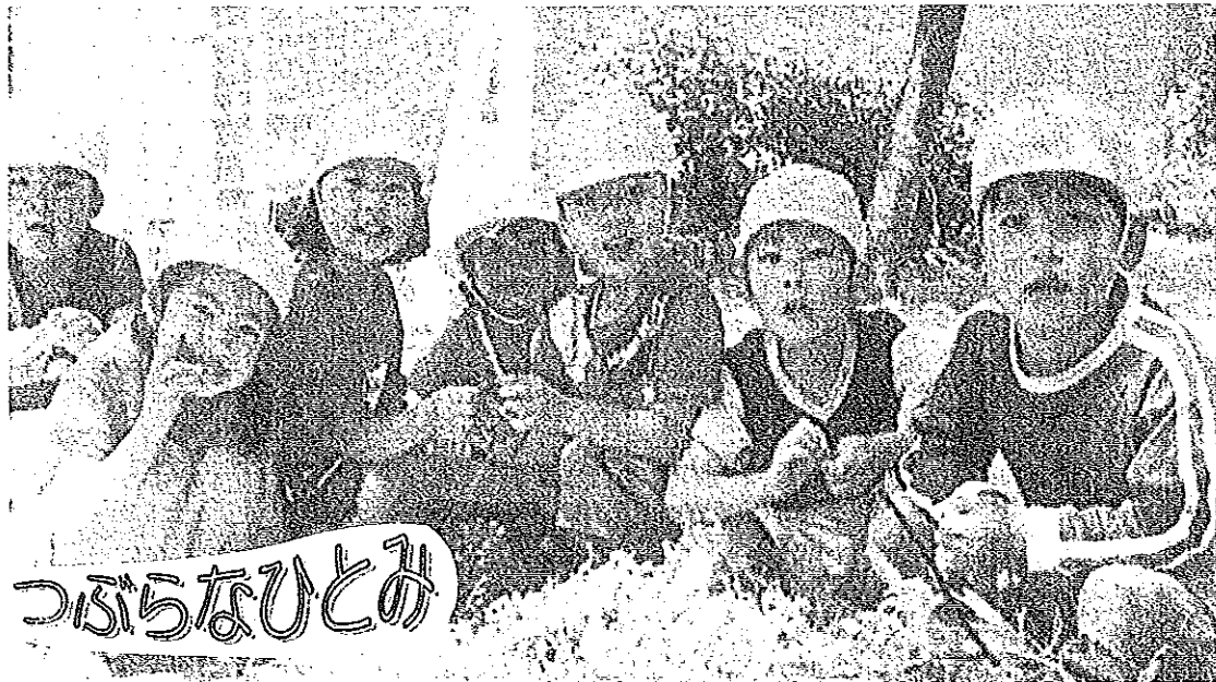
周央保育園の園児たち（園庭にて）