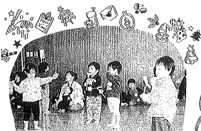
2ヶ月に1回のペースで開かれている『サークルゆりかご』です。子どもたちの楽しそうな笑顔がいっぱい。今回は、竹とんぼならぬ紙とんぼを作って遊びました。