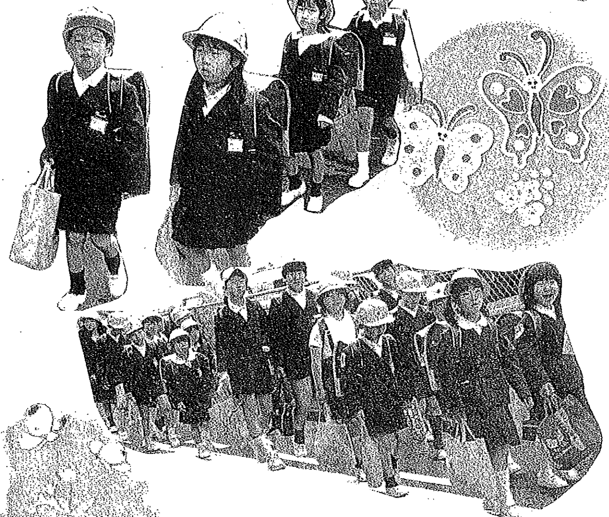
お兄さん お姉さんと一緒に集団登校 もう 学校に なれたかな？