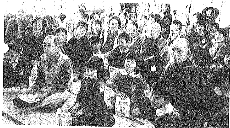
去る、二月十八日(水)周陽幼稚園の園児たちが、老人ホーム「さすなな」を訪問しました。