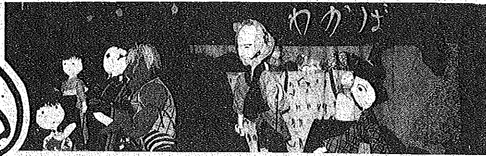
子どもたちのこの真剣な眼差し