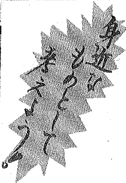
●今月の「土曜日おもしろ文庫」は、11日(土)です。