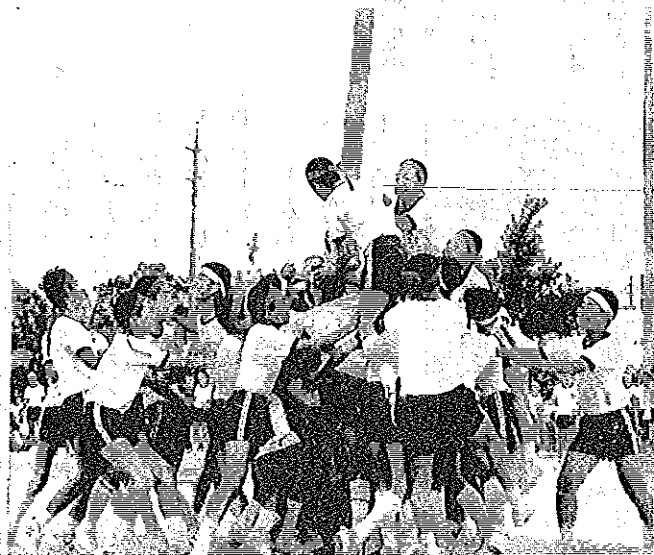
小・中学校 秋季運動会最終行の 九月十三日に行われた中学校の運動会 は、雨模様で少し心配しましたが、九月 二十七日に開催された小学校の運動会は 絶好の天候で開催されました。 小学校の運動会は毎年予行演習を開催 していましたが、今年は雨で中止となり ぶっつけ本番となりました。しかし生徒 の演じる演技に拍手喝采！たいへんよく できました。

小学校の運動会は毎年予行演習を開催していましたが、今年は雨で中止となりぶっつけ本番となりました。しかし生徒の演じる演技に拍手喝采！たいへんよくできました。