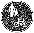
(自転車および歩行者専用)