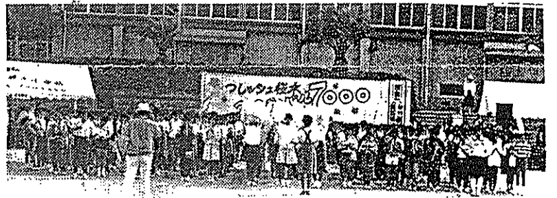
(オープニング演奏・桜木小)