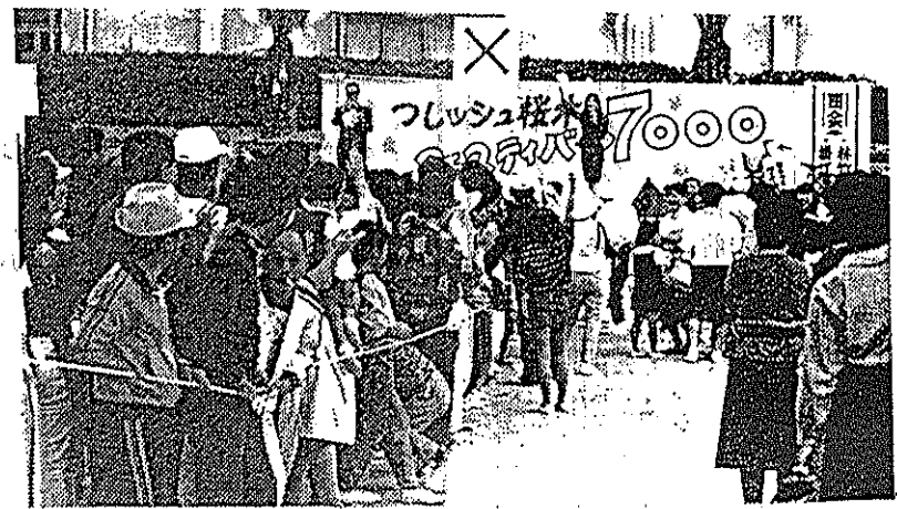
(右?左?どっちな?桜木ウルトラクイズ)