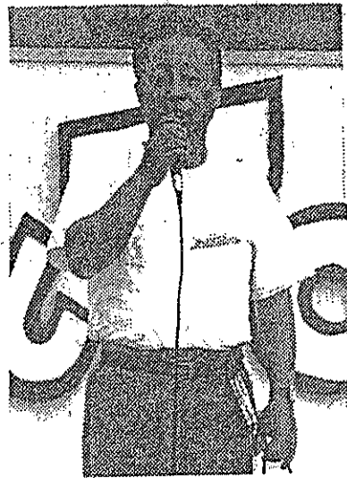
(コミ会長・開会挨拶)