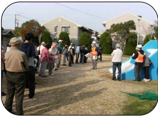
第一次避難所へ集合（公園）

今回、桜木地区では、地域住民主体による「避難・避難所運営」を中心とした防災訓練が桜木小学校と徳山大学の2箇所を避難所として実施されました。