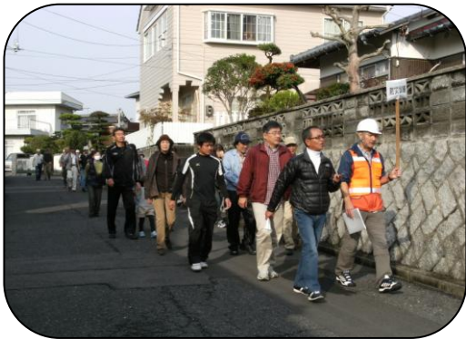
第二次避難所(徳山大学)へ移動