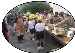
炊き出しの豚汁配給 （桜木小学校）