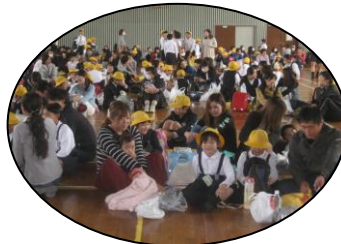
小学校避難所内の様子 （体育館）