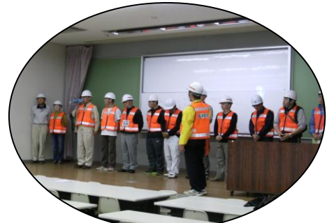
避難誘導者の紹介