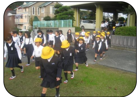
運動場への第一次避難