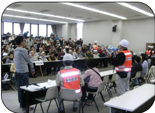
徳山大学避難所内の様子