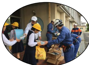
非常食・非常水の配給