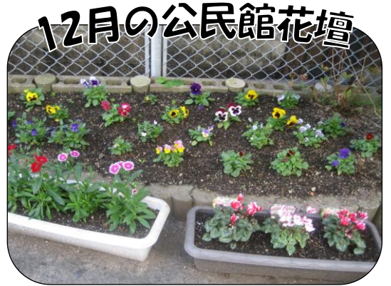
パンジー、ピオラ、シクラメン、などでしこを植えてはなやかに became. 東側の花壇は、何を植えようかな?