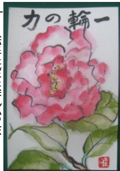
絵手紙を楽しむ会 佳子さん

今月の朝市(縁)じょい!ヶ丘 は、正月用品を取り揃え 12月18日(日) 9:00~ 場所:城ヶ丘公園 で行います。