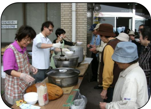
炊き出しの豚汁配給（徳山大学）