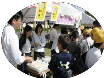
バザー出店！今年も天気に恵ま れ、冷たいものが人気です。