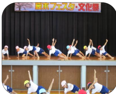
幼稚園児のスマイル体操。 頑張って、片手でしっかり体を 支えて1・2・3