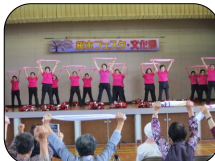
サルビアの皆さんのタオル体操 に合わせて会場の人も体を動か しました。体が軽くなりました。