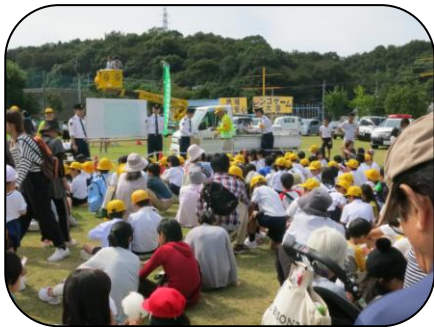
周南警察署のビンゴゲーム大会 会場はとても盛りあがっています。