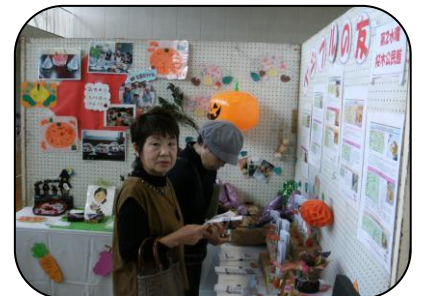
「ベジフルの友」のたくさんの レシピ。今日は何にしようかな？