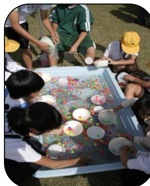
人気のスーパーボールすくい 金魚すくいより簡単な！