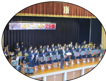
周陽中学校吹奏楽部の演奏。 知ってる曲に、 会場ノリノリ♪