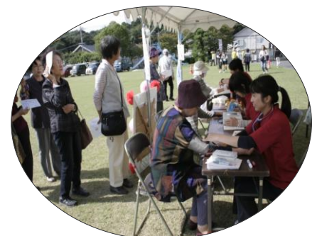
健康測定コーナー 年齢よりも、若い結果に 喜ぶ人・・・そうでない人も！