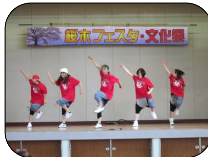
リズムに乗った軽快なダンス。 夏祭りで大人気のアソシエイ ツ！フェスタでも・・・